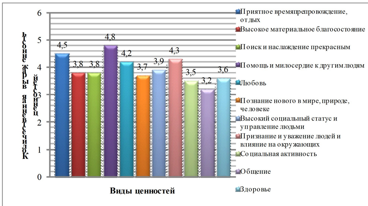
Рисунок 1 – Средние результаты диагностики реальной структуры ценностных ориентаций личности в выборке исследования

При анализе показателей личностной ориентации студентов всей выборки с ранжированием по группам и курсам отмечен отчет-