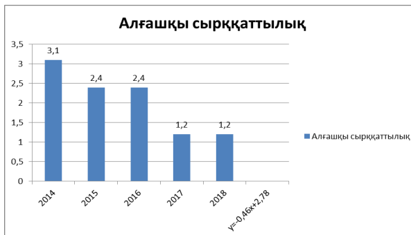
2 сурет – Қарағанды қаласының тұрғындары арасында артериялық гипертензиямен алғашқы аурушандық динамикасы (1000 адамға шаққанда)