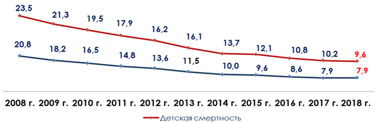
Рисунок 2 – Динамика снижения детской и младенческой смертности в Республике Казахстан (на 1 000 родившихся живыми)