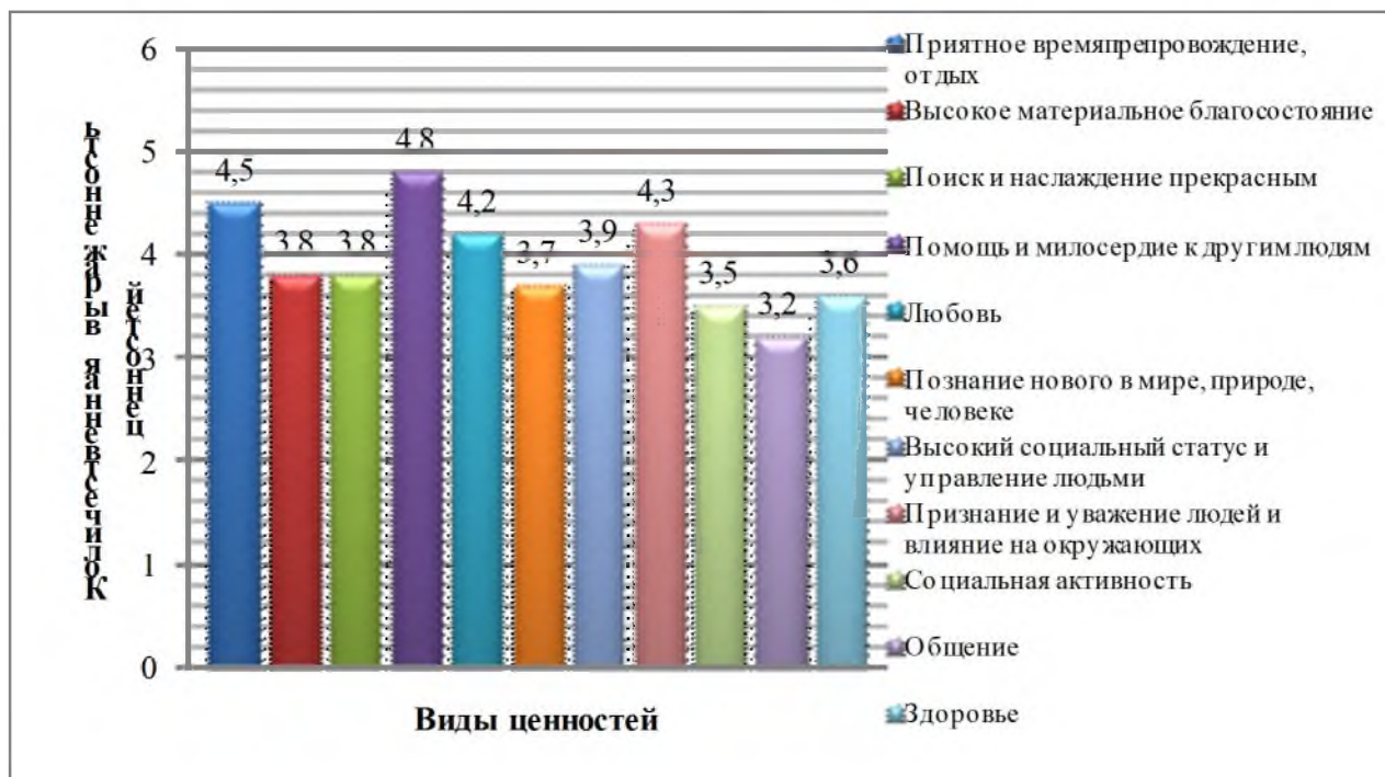
Рисунок 1 – Средние результаты диагностики реальной структуры ценностных ориентаций личности в выборке исследования

При анализе показателей личностной ориентации студентов всей выборки с ранжированием по группам и курсам отмечен отчет-