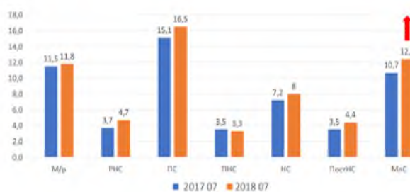
Рисунок 2 – Сравнительная характеристика основных показателей младенческой смертности по Костанайской области