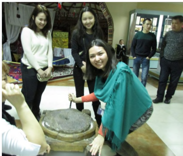
Рисунок 2 – У каменной зернотерки (апрель 2014 г.)

По теме «Казахстан в период Средневековья (VI-XVIII вв.)» студенты I курса в залах Областного краеведческого музея знакомятся с экспонатами эпохи Средневековья. Экскурсоводы разрешают дотронуться до артефактов той эпохи, предметов материальной и духовной культуры (рис. 1). При рассмотрении вопроса о хозяйстве казахского народа в Средневековье, студентам предлагается попробовать поработать настоящей каменной зернотеркой. При этом сообщается, что подобная тяжелая работа в средние века была уделом женщин (рис. 2).