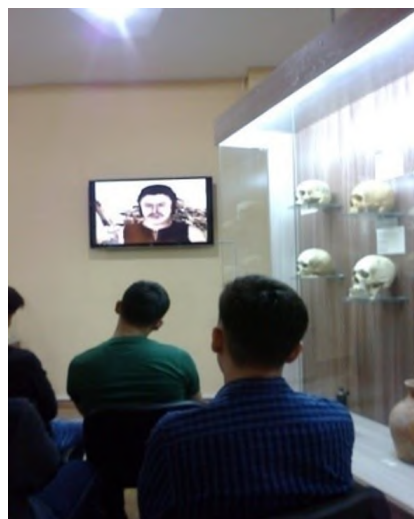
Рисунок 3 – Просмотр учебного фильма (март 2015 г.)

репрессий студентам предлагается присесть на табурет в кабинете следователя НКВД, студентов «запирали» на несколько секунд в тюремной камере. Студенты во время экскурсии знакомятся с артефактами той эпохи: мрачными тюремными камерами, видят фигуры конвоиров и следователей (рис. 5). Студенты видят слезы на глазах узников, сидящих на грубых деревянных нарах (в музее имеются восковые фигуры, выполненные в рост человека). После посещения Музея политических репрессий в пос. Долинка студенты высказывали такие мысли и суждения вслух: «Как хорошо, что мы живём не при тоталитарном режиме! Как выдержали такое старшие поколения?». Подобные экскурсии, несомненно, очень сильно воздействуют в эмоциональном плане на студентов и помогают воочию увидеть и почувствовать тоталитарную эпоху.