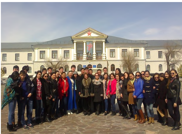
Рисунок 5 – Музей политических репрессий (апрель 2015 г.). Студенты факультета «Общей медицины и стоматологии» I курса вместе с преподавателями кафедры истории Казахстана и социально-политических дисциплин

На занятиях по СРСП в 2014/2015 учебном году в Музей политических репрессий студенты специальностей «Общая медицина», «Общественное здравоохранение» и др. выезжали на экскурсии неоднократно, при этом их сопровождали преподаватели кафедры (рис. 5). В текущем учебном году подобные поездки также запланированы в рамках СРСП.