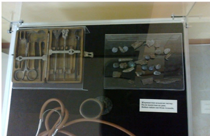
Рисунок 8 – Инструменты Г. Алалыкина. Областной краеведческий музей (2015 г.)

ситься к прошлому. Это подтверждают ответы студентов в анкетах обратной связи, которые заполняются в конце каждого семестра после окончания курса истории Казахстана. В анкетах студенты в большинстве своем отмечают, что подобные формы занятия интересны и помогают лучше познавать прошлое, запомнить важные исторические события.